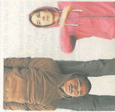
„O Snap“ erzählt die Geschichte von Freundschaft.

Info Weitere Informationen zum Tanzfestival „take-off“ im Tanzhaus NRW gibt es im Internet unter www.take-off-junger-tanz.de .